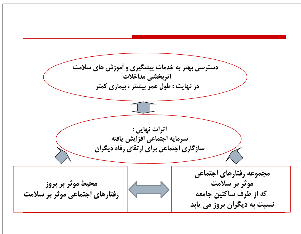
شکل ۲: الگوی مفهومی سلامت اجتماعی